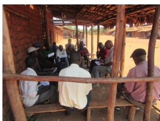
Figure 1: Discussions avec le groupe des hommes à Carire

Des discussions focus groupes ont été réalisées à Carire et Murayi, les sites du projet Cluster 4. Dans chaque site, deux groupes ont été organisés à savoir un groupe de femmes et un groupe d'hommes. Chaque groupe avait entre 8 et 10 participants. Après avoir identifié les types d'élevage les plus importants dans la zone, les discussions portées sur les avantages et les limitations de chaque type d'élevage, la quantité et la qualité du fumier produit, la source des aliments et l'utilisation des revenus retirés de l'élevage.