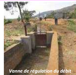
Vanne de régulation du débit

Comme résultat, le périmètre irrigué de l'ISABU situé dans la partie aval (162,6 ha) est de nouveau desservi en eau d'irrigation et cela permettra d'accroître la production des semences de qualité. Le périmètre amont (99,5 ha) a été réhabilité au profit de 300 membres de l'association SHIGIKIRITERAMBERE. Ces derniers pourront augmenter leurs productions agricoles pendant la saison sèche. Les travaux rémunérés de nettoyage et de calibrage des canaux et drains ont été exécutés par les membres de la même association sous l'encadrement de la Direction Provinciale de l'Agriculture et de l'Elevage (DPAE). A la fin des travaux, une partie du matériel utilisé lors de la réhabilitation a été affecté à cette association et à l'ISABU pour un entretien périodique.