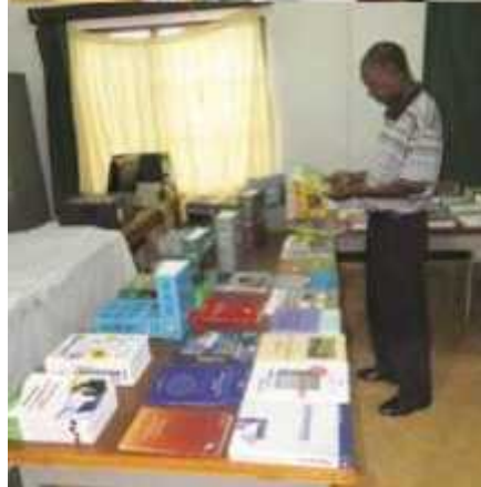
Un Chercheur en train de lire l'un des nouveaux livres