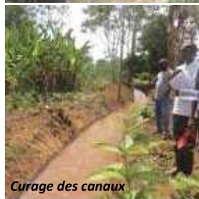
Curage des canaux