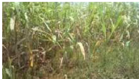
Champ de sorgho infesté par le Striga asiatica

Le Striga asiatica , appelé goutte de sang en français, a été identifié dans plusieurs champs de sorgho de la commune de Bukemba, province Rutana. C'est une plante dont la taille peut atteindre 90 cm, de feuilles vertes et de fleurs rouges d'environ 1,5 cm de diamètre à la floraison.