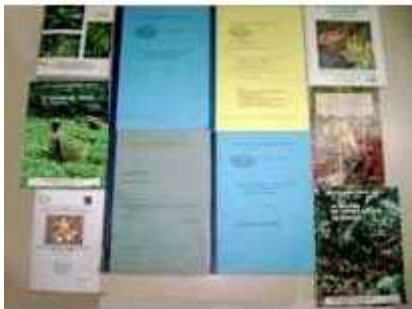
Quelques publications de l'ISABU

La Bibliothèque de l'Institut des Sciences Agronomiques du Burundi (ISABU) a été créée en même temps que l'Institut en 1962. Pendant une cinquantaine d'années d'existence, elle a constitué une collection importante de publications comprenant des rapports annuels, des notes techniques, des fiches techniques, des études pédologiques, des publications agricoles éditées, dans le temps, à Bruxelles par l'Administration Générale de la Coopération au Développement (Actuellement Direction Générale de la Coopération Internationale), etc.