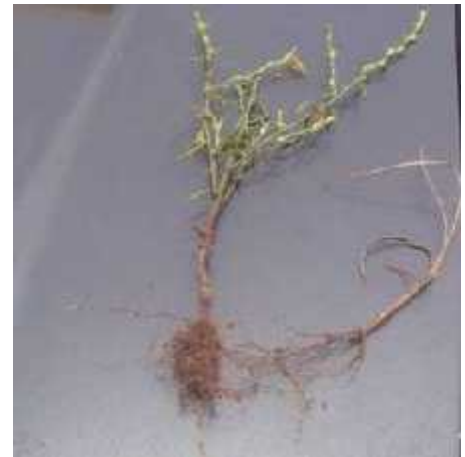
Un plant de sorgho infesté par le Striga asiatica dès sa germination

entraîne une chute de rendement très considérable.