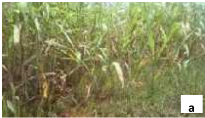
Plants de sorgho infestés et affaiblis par le Striga asiatica