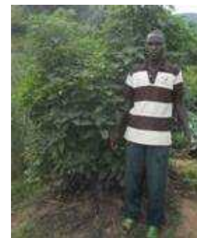
Agriculteur heureux avec ses plants d'amarante