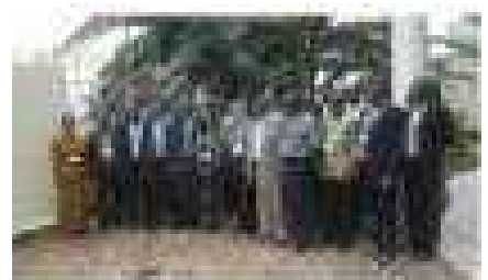
Vue des participants