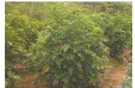
Champs d'amarante var. Garukirabarimyi