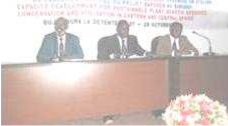
Lancement officiel du Projet

Un atelier de lancement du Projet sur le "Développement des capacités pour la conservation et l'utilisation des ressources génétiques pour la productivité agricole, la résilience et les moyens de subsistance viables en Afrique Centrale et de l'Est » a été organisé en date du 27 octobre 2014, à l'hôtel La Détente à Bujumbura. Au cours de cet événement, des présentations, des discussions et une visite de champs de maintien du germoplasme local à Murongwe - un Centre