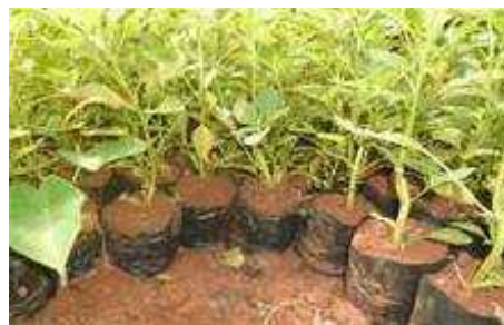
Pépinières de production des plants d'amarante par bouturage