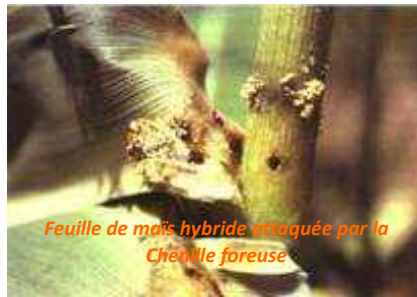
Feuille de maïs hybride attaquée par la Chenille foreuse