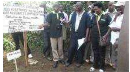
Parcelles de maintien du germoplasme

Une visite sur le terrain à Murongwe a été effectuée où on a installé sur 40 ares une collection des plantes annuelles vivrières de 25 accessions d'igname, 15 types de colocase, 5 variétés de courges, 100 accessions d'Idodoke, 5 espèces de cucurbita, 1 type d'espèce de Zingibes.