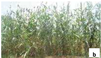
Plants de sorgho indemnes et vigoureux