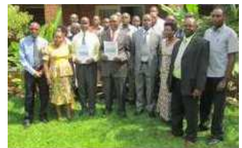
Vue des participants