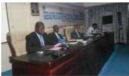
Lancement officiel du Projet

Un lancement officiel du Projet « Agroforesterie pour Améliorer la Sécurité Alimentaire en Afrique Orientale ( TREES FOR FOOD SECURITY in Eastern Africa ) » a eu lieu le 12 novembre 2014 à l'hôtel Le Panoramique.