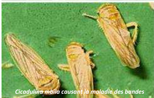
Cicadulina mbila causant la maladie des bandes