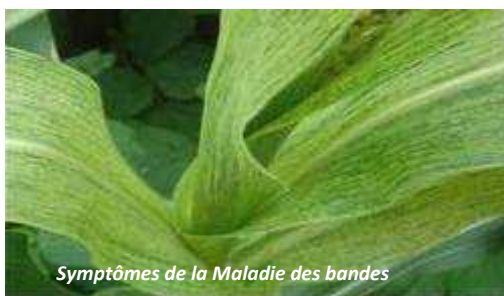
Symptômes de la Maladie des bandes