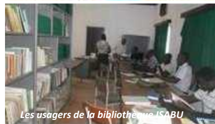
Les usagers de la bibliothèque ISABU

Tout ce fonds documentaire est mis à la disposition de ses usagers comprenant