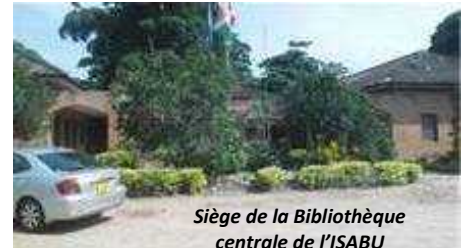
Siège de la Bibliothèque centrale de l'ISABU

Elle est logée dans le bâtiment du site de l'ISABU/Pré vulgarisation, au Boulevard Yaranda.