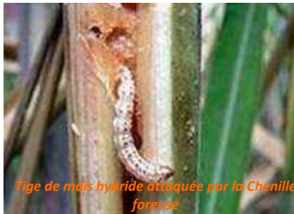
Tige de maïs hybride attaquée par la Chenille foreuse

Traiter au Dursban: 2 centilitres par litre d'eau, 30 centilitres pour un pulvérisateur. La pulvérisation sera fait avant 10 h ou après 16 h. Il faudra veiller à pulvériser l'ensemble de la plante. En cas de pluie, la pulvérisation devra être refaite.