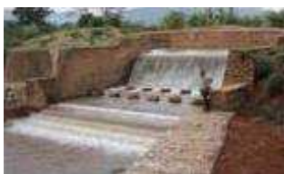
Prise d'eau dans la rivière MUSASA

C'est dans ce cadre que le Programme d'Appui Institutionnel et Opérationnel au Secteur Agricole (PAIOSA) de la Coopération Belge au Développement a financé la réhabilitation du réseau et la réparation de la prise d'eau depuis la rivière MUSASA.